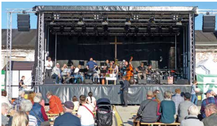
1. WermelsKirchenTag am 8. und 9.10.2021 mit Traumwetter – EFG Wermelskirchen (efg-wermelskirchen.de)

Unter musikalischer Begleitung der Band MAD (EFG Neuschäferhöhe) und eines gemischten Posaunenchores unserer Gemeinde sprachen und hörten wir über das Leben. Auch wenn wir wirklich dankbar sind für das herrliche