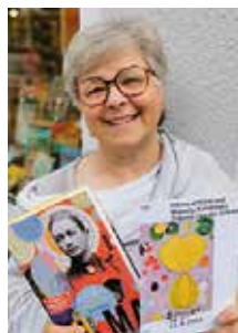
Hilma, von Sofia Lundberg, Alyson Richman und M. J. Rose, ISBN 9783492071390, 24,00 €

Die schwedische Malerin Hilma af Klint packte Anfang des 20. Jahrhunderts ihre Gemälde, Skizzen und Tagebücher in Kisten und verfügte, dass diese erst zwanzig Jahre nach ihrem Tod wieder geöffnet werden dürften. Drei Autorinnen haben sich gemeinsam mit Leben und Werk dieser außergewöhnlichen Künstlerin be-