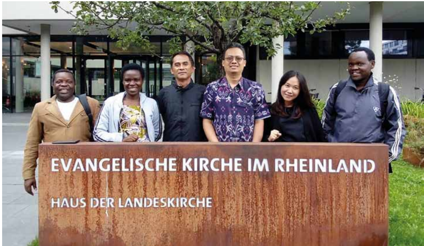
Wir freuen uns, unsere Geschwister aus Ruanda und Indonesien wiederzusehen!

Findig muss dabei unsere indonesische Partnerkirche in ihrer mehrheitlich islamischen Gesellschaft sein, in