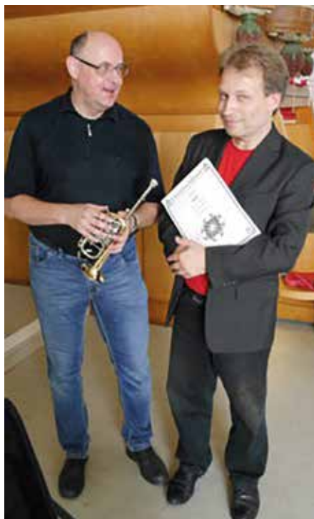
Weidner & Pumpa

Wir laden Sie ein, im Rhythmus der „7“ mit uns zu feiern.