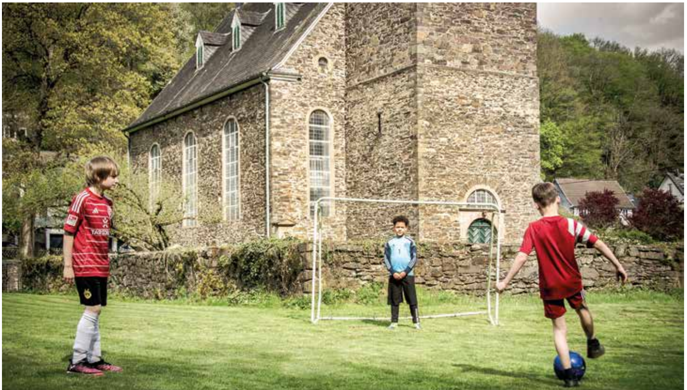
Einige Kinder aus der Nachbarschaft haben die Wiese hinter dem Gemeindehaus schon als Spielwiese entdeckt.

... musst du dir kein Grundstück kaufen. Auf der Wiese hinter dem Gemeindehaus ist viel Platz zum Spielen. Wir haben jetzt Fußballtore bestellt, ihr braucht also nur einen Ball unter den Arm zu klemmen und es kann losgehen. Fußballspielen ist natürlich keine Pflicht. Fangen, Brennball, „Feuer, Wasser, Sturm“ oder was euch sonst noch einfällt: Es gibt viel Platz. Lieber einfach in der Sonne liegen, vielleicht etwas lesen oder picknicken? Dazu laden Tische und Bänke ein. Ihr seid herzlich willkommen.